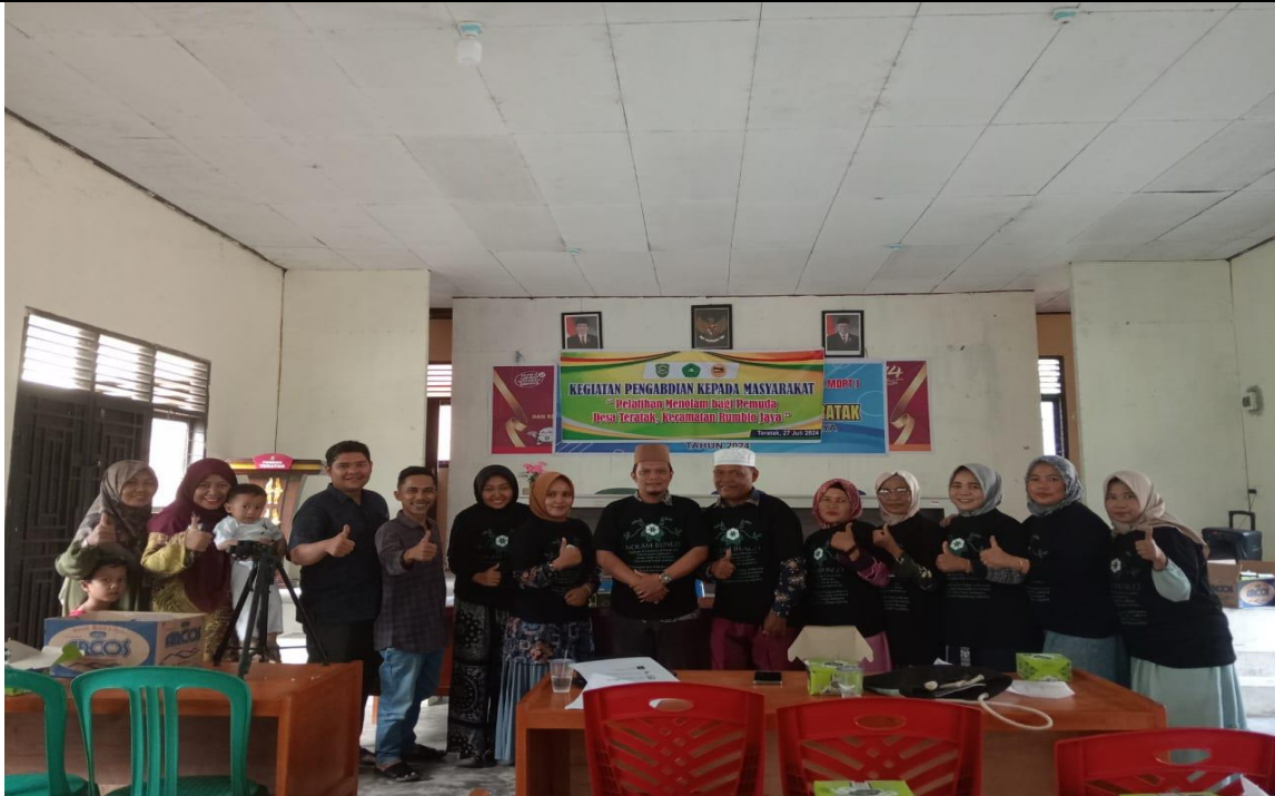
Gabar 1. Peserta Pelatihan Manolam Bagi Pemuda Desa Teratak