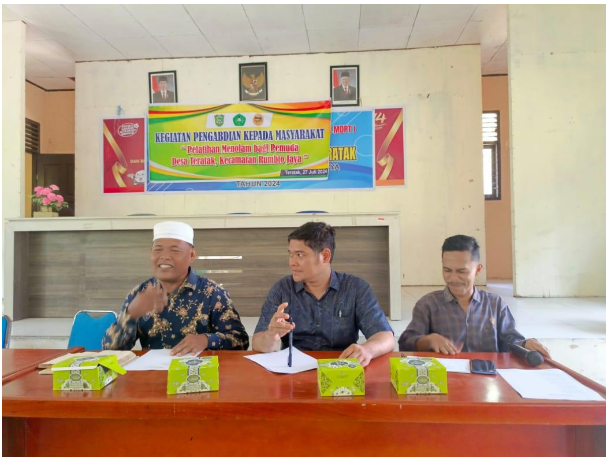
Gabar 2. Pemateri Pelatihan Manolam Bagi Pemuda Desa Teratak