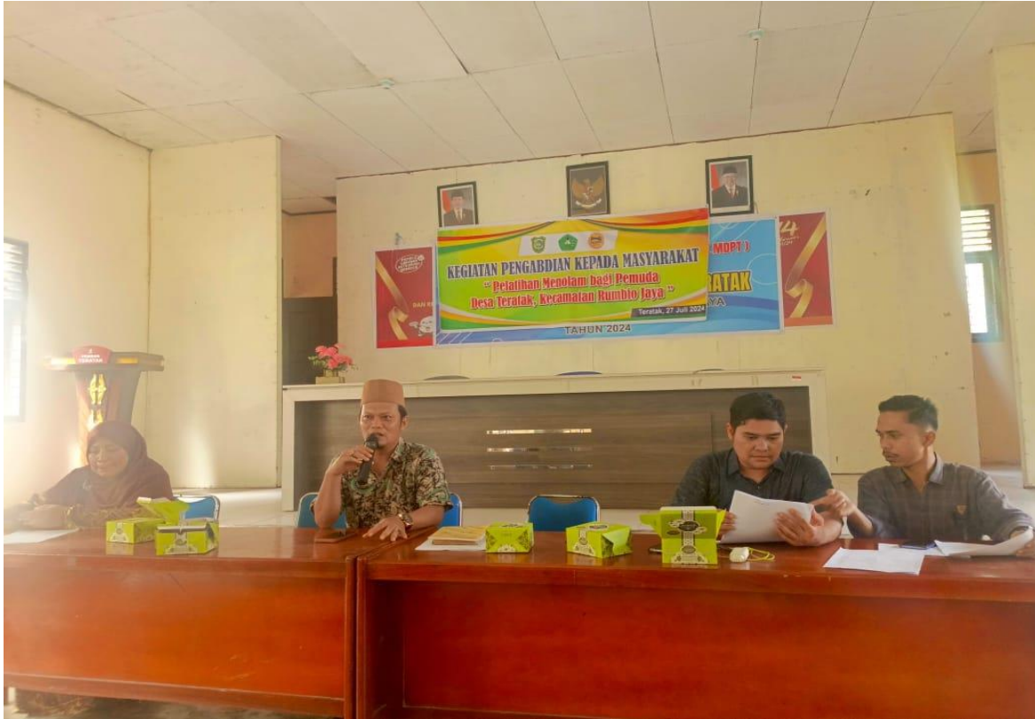
Gambar 4. Kepala Desa Teratak memberikan sambutan

terdapat nolam non kisah seperti nolam bungo dan nolam buruong. Beliau juga seorang penolam handal yang masih tersisa di Kecamatan Rumbio Jaya Kabupaten Kampar. Beliau sangat bersemangat menyampaikan materi sekaligus melatih peserta manolam. Hingga akhir kegiatan, Kepala Desa Teratak turut mendampingi. Beliau turut menyampaikan apresiasi dan harapan kepada tim atas keberlanjutan kegiatan pelatihan ini.