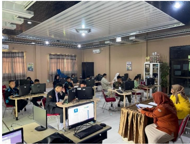
Gambar 4. Foto Peserta Pengabdian kepada masyarakat