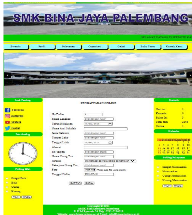
Gambar 3. Halaman PPDB

Langkah selanjutnya calon peserta didik baru diarahkan untuk melakukan registrasi terlebih dahulu sebelum melakukan login. Setelah melakukan registrasi dan mengisi formulir yang disediakan pada menu portal PPDB, calon peserta didik baru diarahkan untuk langsung login pada portal PPDB. Setelah berhasil login calon peserta didik baru diarahkan untuk mengisi formulir dengan lengkap dan mengupload sejumlah dokumen yang dibutuhkan. Semua alur pendaftaran PPDB online juga dijelaskan dalam portal PPDB sebagai berikut.