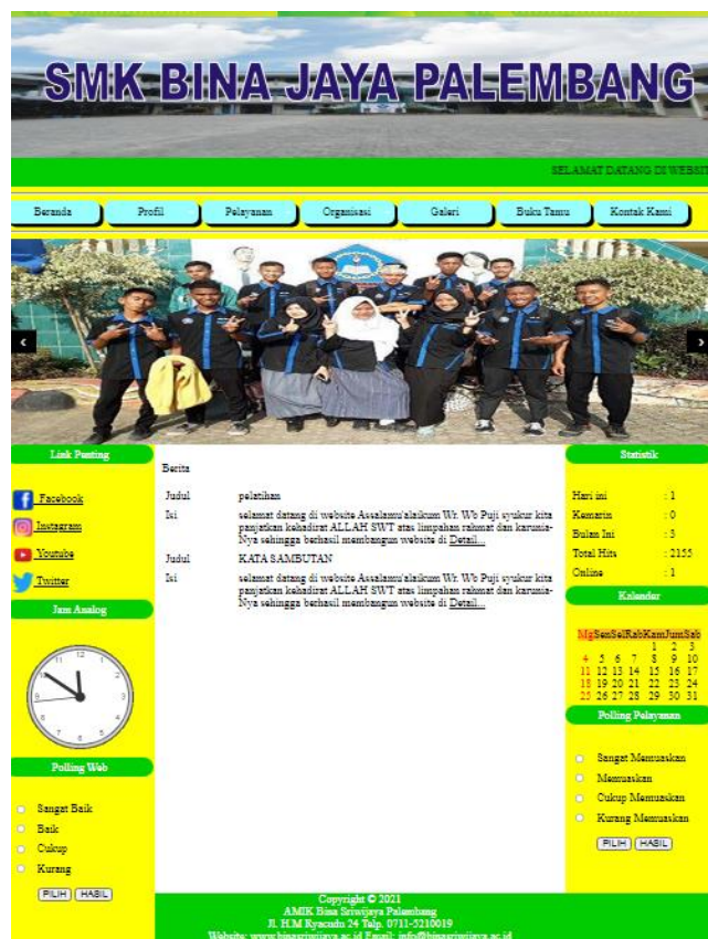
Gambar 2. Halaman Beranda

Berdasarkan gambar diatas diketahui portal PPDB memiliki menu yang lengkap diantaranya terdapat menu pendaftaran, statistik dan info perkuliahan serta portal PPDB ini juga menyediakan menu download brosur Sekolah. Disamping kiri terlihat ada beberapa syarat pendaftaran peserta didik baru yang harus dilengkapi seperti surat keterangan lulus, ijazah jenjang sebelumnya, kartu keluarga, akta kelahiran dan scan rapot, yang seluruhnya dapat diupload pada portal PPDB online tersebut.